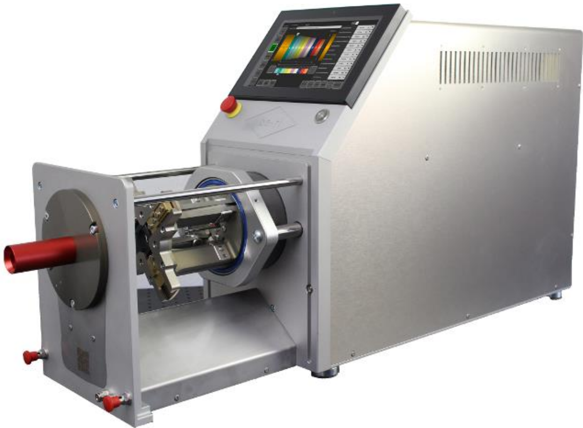
Abbildung ohne Schutzhaube Illustration without protective cover